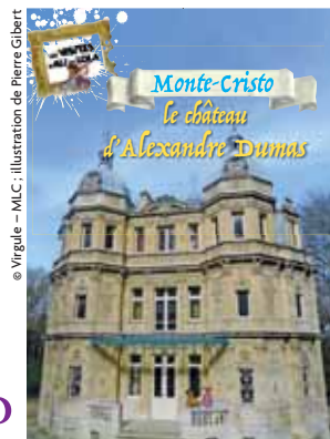
© Virgule - M.C. : illustration de Pierre Gibert