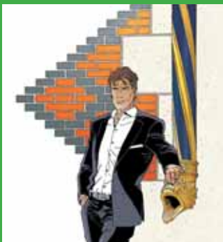
Van Hamme - Francq - Giacometti © Dupuis

➔ Largo Winch, aventurier de l'économie, à découvrir sur www.citeco.fr/largo-winch-aventurier-de-leconomie-0